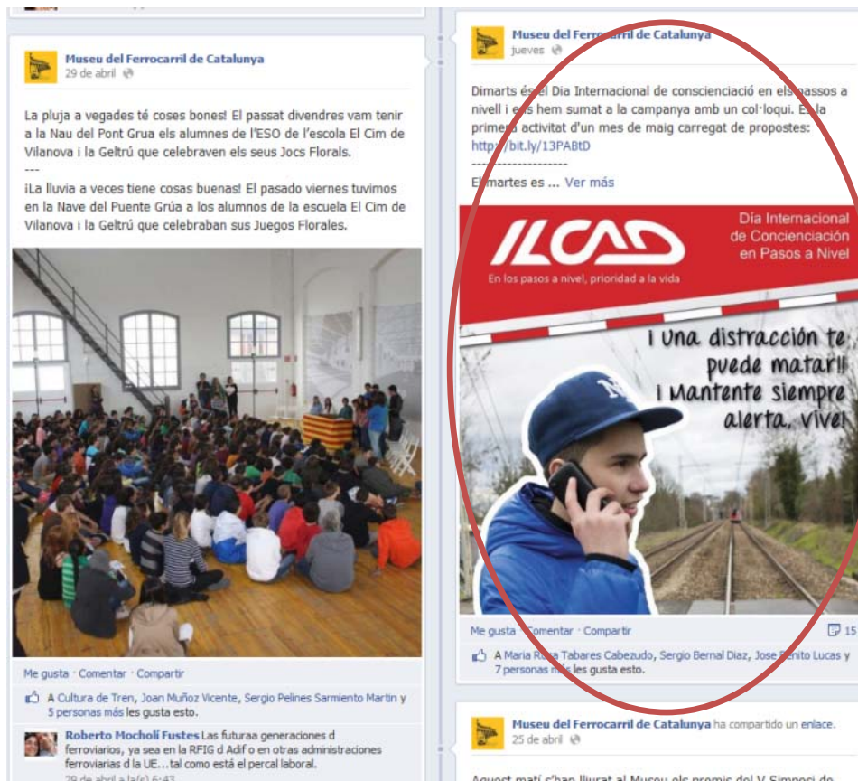
Imagen de la jornada en la página de Facebook del Museo del Ferrocarril de Cataluña ( https://www.facebook.com/museudelferrocarril/ ):

El Museo del Ferrocarril de Cataluña. Vilanova i la Geltrú también difundió el Día Internacional de la Concienciación en los Pasos a Nivel en las redes sociales.